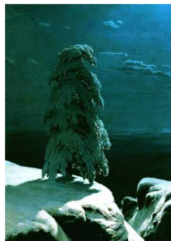
Иван Шишкин. На Севере диком..., 1891.

Творческая составляющая задания может быть усложнена предложением составить словесное описание замысла пейзажа – как заказа художнику, указав желаемую композицию, ракурс, характерные черты изображаемого и способы их достижения.