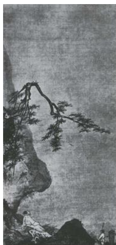
Ма Юань. Лунный свет. Живопись тушью на шелке. XII-XIII вв.

2. Какие эмоциональные доминанты, по Вашему мнению, существуют в каждом произведении?